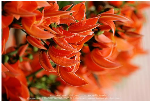
ชื่อ พรรณไม้ : ดอกทองกวาว/ ดอกจันเหลือง