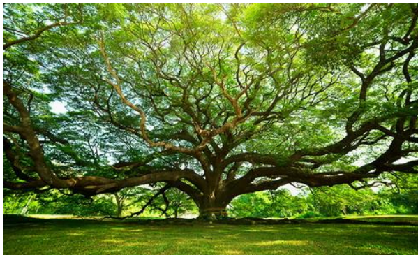
ชื่อ พรรณไม้ : จามจู้รี